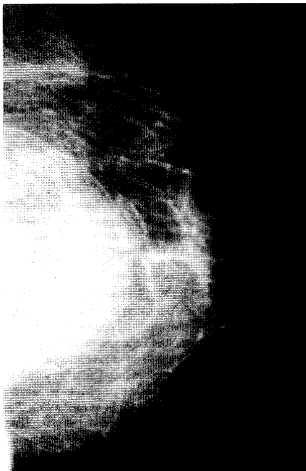
Fig. 1. Mamografía izquierda muestra masa de 9 cm.

Los liposarcomas son tumores de partes blandas extremadamente raros en la mama. Sólo se han descrito en la literatura mundial unos 59 casos 1-11 . De éstos, 4 casos corresponden a la casuística nacional recogidos desde el año 1988 6,7 . En tres casos publicados, el tumor fue bilateral 4 . Raramente afectan a varones. La edad de presentación es en la 4. a -6. a década de la vida. Como en nuestra enferma, el diagnóstico preoperatorio es difícil, ya que las lesiones aparecen como masas regulares, de bordes redondeados y lisos. El rápido crecimiento de las lesiones hacen sospechar malignidad, así como el tamaño, como en nuestro caso, llegando algunos otros a ocu-