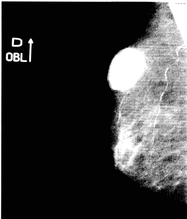
Fig. 1. Mamografía: nódulo oval, denso y bien delimitado.

Microscópicamente se trataba de una tumoración relacionada con la epidermis (Fig. 2), con un área quística, rodeada de una marcada reacción inflamatoria gigantomatosa y xantomatosa con abundantes cristales de colesterol. Las áreas sólidas estaban constituidas por dos tipos celulares epiteliales diferentes: unas células de menor tamaño, con citoplasma denso, muy escaso, y otras de mayor tamaño, con citoplasma poligonal, abundante y claro (Fig. 3), positivo a la tinción de PAS. Llamaba la atención la existencia de un estroma denso, marcadamente hialinizado, eosinófilo y focos de diferenciación ductular. Las tinciones de inmunohistoquímica mostraron intensa positividad para la citoqueratina en las células epiteliales de menor tamaño y débil positividad en las células claras. Las tinciones de vimentina, S-100 y actina fueron negativas.